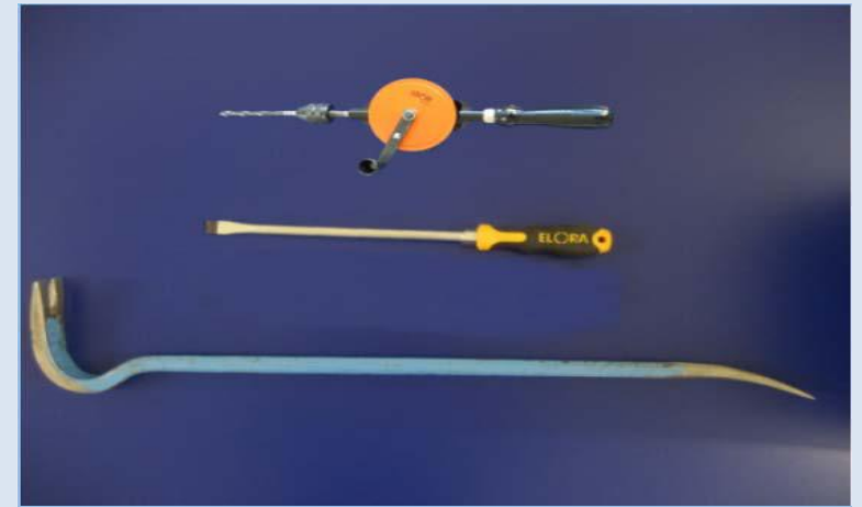
RC3 Werkzeugsatz B (Ergänzend zu Werkzeugsatz A)