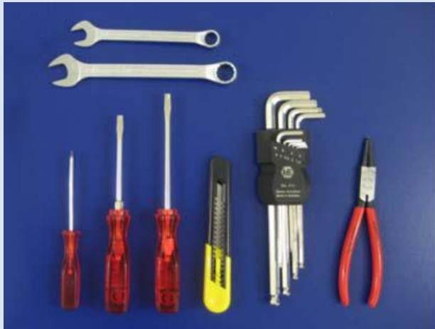
RC2 – RC3 Grundwerkzeugsatz